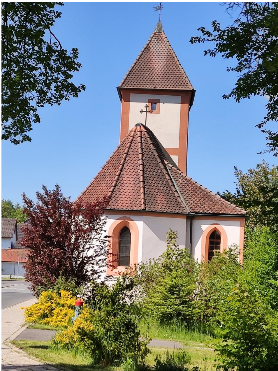
Laurentiuskirche in Hütten