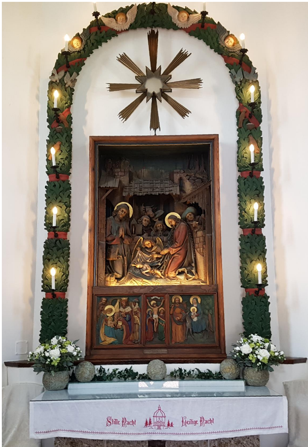
Altarbild, Stille Nacht Kapelle in Oberndorf